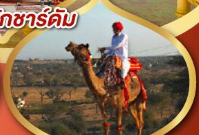
ฟรี ขี่อูฐ เมืองมันทอวา ราคาเริ่มต้น