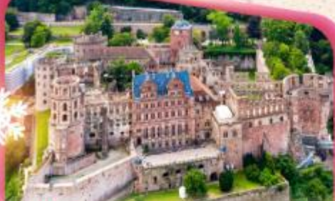
ปราสาทไชลอนเบิร์ก