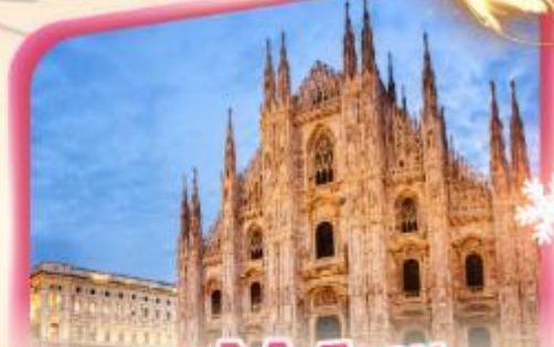
คูโอโมมิลาโน