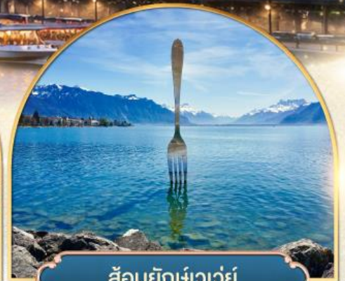
ส้อมยักษ์เวอเวย์