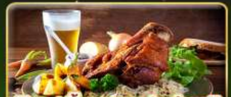
พิเศษ! ลิ้มลองเมนูประจำชาติ ถึง 5 ประเทศ!!!