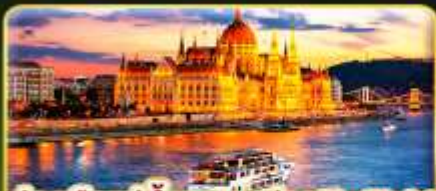
ส่องเรือแม่น้ำดานูบ ช่วง Twilight พร้อมจินตนาการ

📅 เดินทาง: 02-09 ธ.ค. | 06-13 ธ.ค. 10-16 ธ.ค. 69