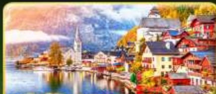
การันตีพัก Hallstatt / St. Wolfgang หรืออินทระเสนา 1 คืน