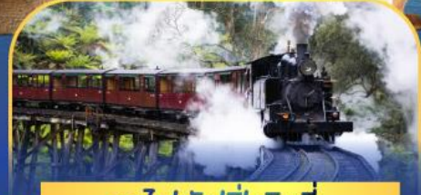
รถไฟพั้งบิลลี่

ล่องเรือชมอ่าวซิดนีย์พร้อมรับประทานอาหารกลางวัน และ เข้าชมสวนสัตว์การองก้า • ล่องเรือชมอ่าวซิดนีย์ • ชมโรงอุปรากรซิดนีย์ • เดินชมย่านเดอะริอคส์ • ดินเนอร์ Half Lobster • บินเที่ยวบินภายในจากซิดนีย์สู่เมลเบิร์น • ชมขบวนพาเหรดนกเพนกวิน • นั่งรถไฟหัวรถจักรไอ้หน้ Puffing Billy • ช้อปปิ้งจุใจในนครเมลเบิร์น