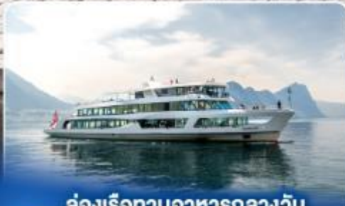
ล่องเรือทานอาหารกลางวัน ทะเลสาบลูซิิร์น