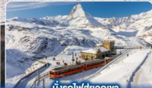
นั่งรถไฟสู่ยอดเขา กรอนเนอร์แกรต