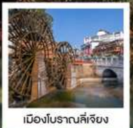
เมืองโบราณลี้เจียง

ต้าหนังกอง / เมืองโบราณต้าหลี่ / เจดีย์สามองค์ / โถง S ทะเลสาบเอ๋อไห่ / ช่องแคบเสื่อกระโดด (รวมบันไดเลื่อนขึ้น-ลง) / เมืองโบราณแชงกรีล่า วัดลามะชงจ้านหลิง (รวมค่ารถขึ้น-ลง) / ชมวิวยามค่ำคืนเมืองโบราณลี้เจียง / ภูเขาหิมะมังกรหยก (นั่งกระเช้าใหญ่) / หุบเขาพระจันทร์สีน้ำเงิน ไม้ส่ายเหอ (รวมรถกอล์ฟ) โชว์จางอ๋อหมว / สระมังกรดำ / คาเฟ่วันท่อน YUN DI AN CAFE / เมืองโบราณลี้เจียง / เมืองโบราณไปซา / วัดหยวนทง / ถนนคนเดินจินนี่ลู่