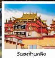
วัดชงจ้านหลิง

ทัวร์คุณภาพ ไม่หลงร้านช้อปปิ้ง ไม่ขายออฟชั่น