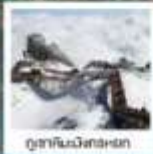
อุทยานวิวัฒนาการ