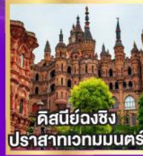
คิสบีย้งฉิง ปราสาทเวทมนตร์