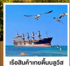
เรือสินค้าเกย์ตันบลูวิส