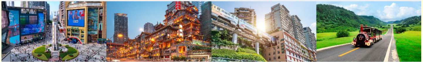
ถนนเจียงฟางเป่ย์