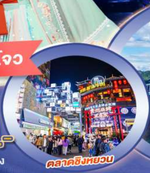
ตลาดซิงหยวน