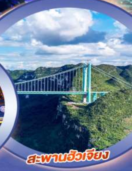
สะพานฮัวเจียง