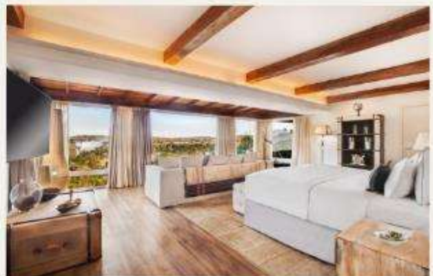
Hotel das Cataratas, A Belmond Hotel