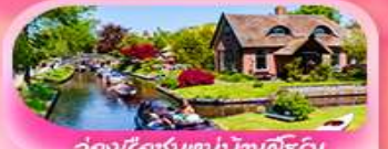
ล่องเรือชมหมู่บ้านทิวไรน์

✈️ เดินทาง 19 - 26 มี.ค.69 / 27 มี.ค. - 3 เม.ย.69 2 - 9 เม.ย.69 / 9 - 16 เม.ย.69 28 เม.ย. - 5 พ.ค. 69 / 3 - 10 พ.ค.69